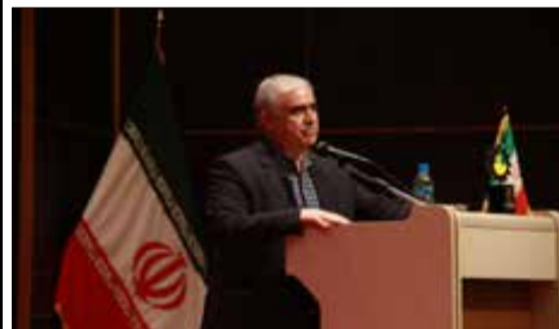
مهندس پرویزی استاندار خراسان جنوبی

اقتصاد و معیشت مردم شاهد خواهیم بود. در پایان از ادارات کل تعاون، کار و رفاه اجتماعی، راه آهن شرق کشور و شرکت آب منطقه‌ای استان به عنوان دستگاه‌های اجرایی برتر، شرکت‌های فناور و دانش بنیان دانشجویار خاوران، زیست سپیدان حیات پایا و فروهر فناور کوروش به عنوان شرکت‌های دانش بنیان برتر، دانشگاه‌های آزاد اسلامی واحد بیرجند و علوم پزشکی و خدمات بهداشتی و درمانی بیرجند به عنوان مراکز پژوهشی برتر و واحدهای صنعتی شمش فلز منیزیم رویال فردوس، درنمای شرق و چاپ مینای سرخ شرق به عنوان واحدهای صنعتی برتر استان تجلیل به عمل آمد. ۶۶